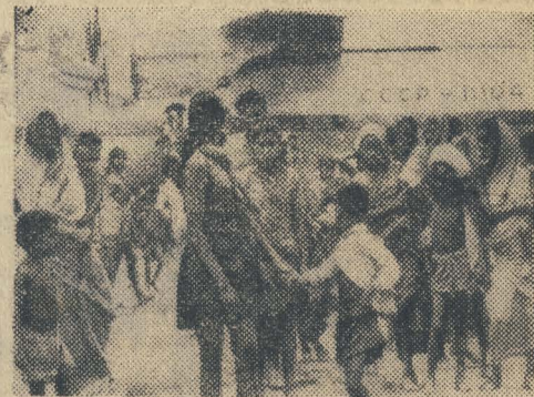
Десятки тысяч убитых. Множество раненых. Миллионы беженцев. Таково последствие военных действий в Восточном Пакистане. Скудность людей привела к эпидемиям. Им не хватает хлеба, воды. И, как всегда, первыми на помощь пришли советские люди. Самолёты Аэрофлота помогают Индии вывозить беженцев из Калькутты в глубь страны.

Б. КУЗЬМЕНКО. Казахская ССР, Алма-Атинская область.