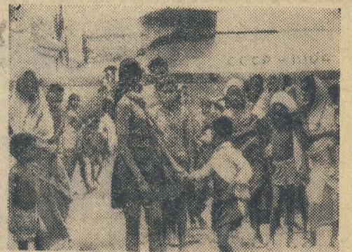
Десятки тысяч убитых. Множество раненых. Миллионы беженцев. Таковы последствия военных действий в Восточном Пакистане. Скудность людей привела к эпидемиям. Им не хватает хлеба, воды. И, как всегда, первыми на помощь пришли советские люди. Самолёты Аэрофлота помогают Индии вывозить беженцев из Калькутты в глубь страны.

Б. КУЗЬМЕНКО. Казахская ССР, Алма-Атинская область.