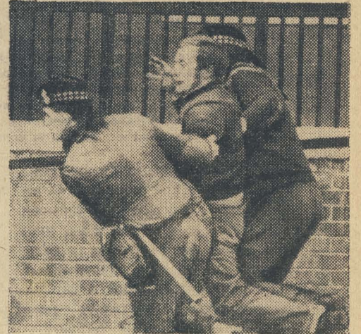
Вот уже много месяцев почти каждый день телеграф приносит тревожные известия из Белфаста, столицы Северной Ирландии. Английские солдаты пытаются силой подавить выступления борцов за гражданские права.