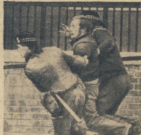
Вот уже много месяцев почти каждый день телеграф приносит тревожные известия из Белфаста, столицы Северной Ирландии. Английские солдаты пытаются силой подавить выступления борцов за гражданские права.